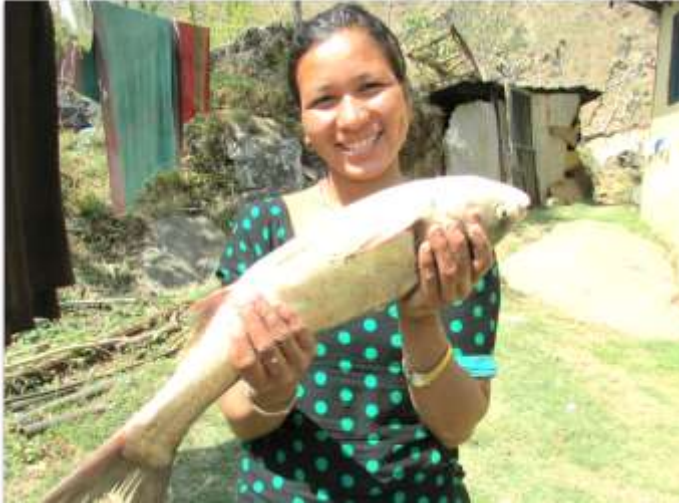
visserij in de bergen van nepal

14 oktober 2018 'zondag Werelddiakonaat'