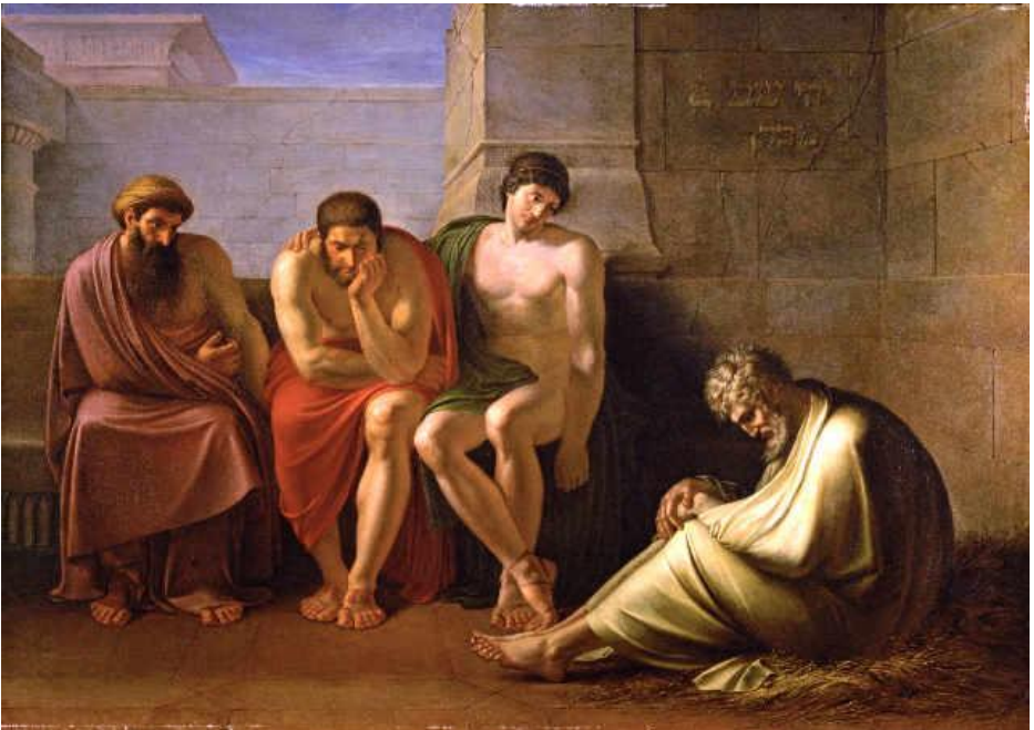
Hiob und seine Freunde - Eberhard von Wächter (1762–1852)